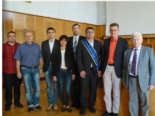
Mitglieder der DonNTU Donezk mit ihrem neuen Ehrendoktor