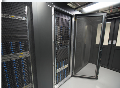
Neuer Serverraum in der Staudingerstraße

Das Spektrum reicht dabei von Untersuchungen zur elektrochemischen Energiewandlung und -speicherung, die z.B. zu einem besseren Verständnis der Prozesse an elektrochemischen Grenzflächen geführt