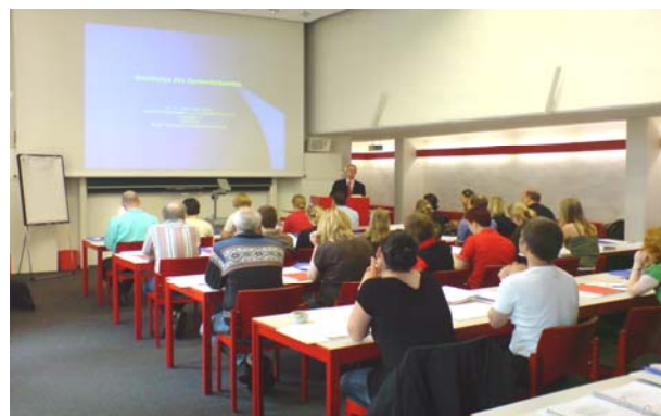
Seminar auf der Reisenburg

In Deutschland und Europa ist durch eine strenge Gesetzgebung ein hohes Sicherheitsniveau bei der Anwendung gentechnologischer Methoden gewährleistet. 1990 wurde in Deutschland das Gentechnikgesetz erlassen, das den rechtlichen Rahmen für alle gentechnischen Arbeiten bundesweit bildet. Die letzte Novellierung, mit der das Gentechnik-Gesetz und weitere Rechtsvorschriften geändert wurden, ist am 4. April 2008 im Bundesgesetzblatt veröffentlicht worden. Das