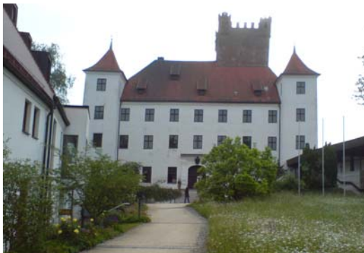
Hauptgebäude auf der Reisenburg

Das zweitägige Seminar wurde in den Räumen der Reisenburg durchgeführt. Die Möglichkeit auf der Reisenburg zu übernachten wurde von vielen Teilnehmern genutzt. Die überwiegende Anzahl der Teilnehmer waren Naturwissenschaftler und Mediziner, die eigenverantwortlich gentechnische Arbeiten durchführen wollen. Daneben wurde der Kurs aber auch von technischem Personal besucht. Obwohl diese nicht eigenverantwortlich tätig werden dürfen (hierfür ist ein abgeschlossenes naturwissenschaftliches oder medizinisches