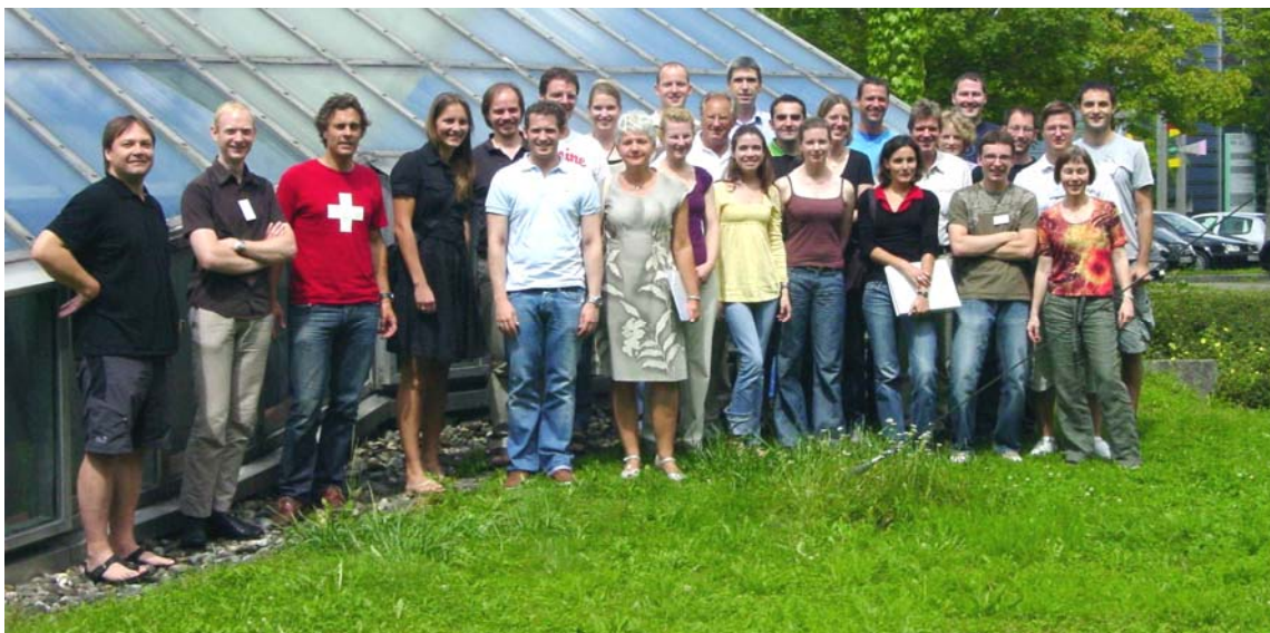
Teilnehmer und Dozenten des Kursprogrammes 2009

Die Evaluation am Ende des Kurses 2009 ergab eine hohe Zufriedenheit der Kursteilnehmer.