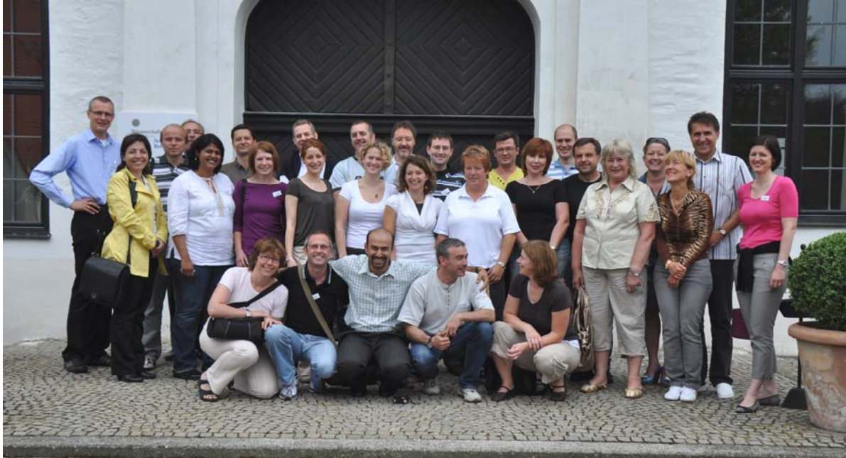
Kurs "Cryopreservation" vom 16.-18.7.2009 im Wissenschaftszentrum Schloss Reisenburg

that are available for vitrification and thawing, which can be used for any stage of human pre-implantation cells. The third part of the course will allow intensive discussions regarding the methods used and the means and ways of assessing their viability. Important issues in this session are the aseptic vitrification of mammalian oocytes and embryos and the cryoprotectant-free vitrification of human ICSI spermatozoa”.