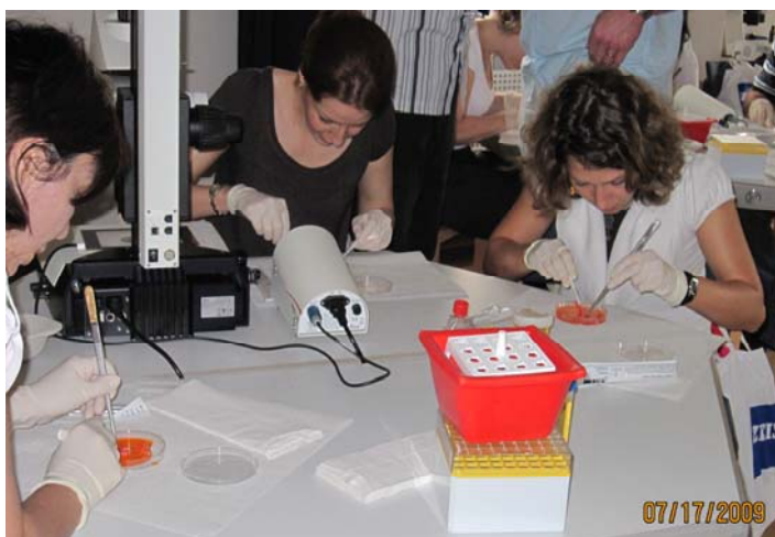
Kurs "Cryopreservation" bei praktischen Übungen

An dem Kurs Nr. 3 zum Thema „Cryopreservation of Mammalian Ovarian Tissue as well as Spermatozoa, Oocytes, Embryos by Conventional (Programmed) Freezing and Vitrification for Oncology and Reproductology“ nahmen 22 Personen aus 13 Ländern teil (Australien, Belgien, Deutschland, Griechenland, Italien, Kasachstan, Malaysia, Norwegen, Österreich, Russland, Tschechien, Ukraine und USA). Er fand vom 16.-18.7.2009 im Wissenschaftszentrum Schloss Reinsburg statt. Inhaltlich war dieser Kurs wie folgt strukturiert