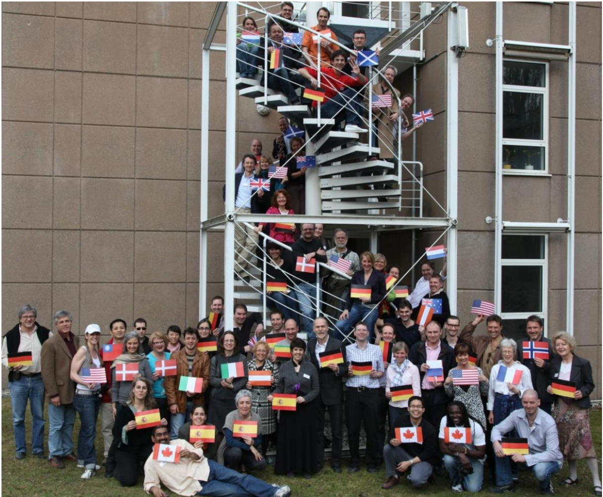
Die Teilnehmer des weltweit ersten Faszien-Forschungskurses an der Universität Ulm. Mit ihren Landesfahnen dokumentierten sie beim Gruppenfoto die internationale Resonanz dieses Treffens.

beträchtlicher Teil der Teilnehmer versuchte ferner, sich gleich für den nächsten Faszienforschungskurs an der Universität Ulm (im Sommer 2012) anzumelden, obwohl hierfür eine Registration noch gar nicht möglich war. Auch das war eher kein Zeichen einer großen Unzufriedenheit mit diesem weltweit ersten interdisziplinären Faszienforschungskurs.