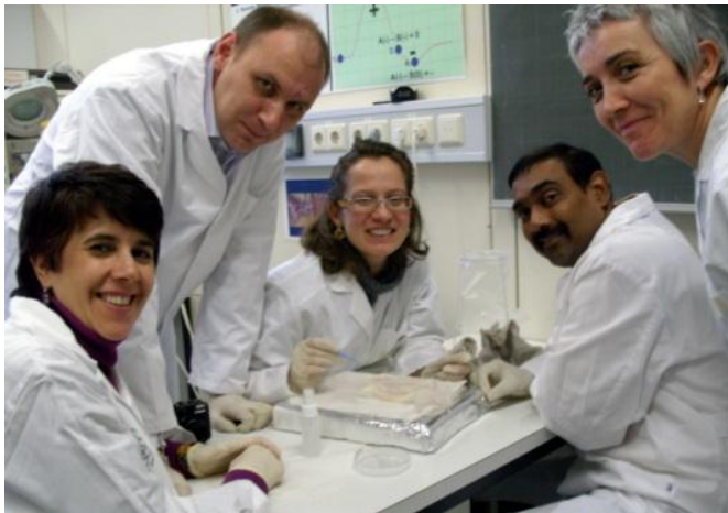
Teilnehmer bei der Kleingruppenarbeit. Hier Präparation der unterschiedlichen Bindegewebsschichten, die beim Rückenschmerz eine Rolle spielen könnten.

Der Kurs wurde in englischer Sprache abgehalten. Eine ursprünglich geplante Übersetzungsoption ins Deutsche konnte wegen der unerwartet hohen Teilnehmerzahl aus dem Ausland sowie aufgrund der allgemein guten Sprachkenntnisse der inländischen Teilnehmer fallengelassen werden. Nur etwa die Hälfte der Kurszeit bestand in Plenums-Vorträgen der Referenten; der Rest aus unterschiedlich thematisch ausgerichteten Kleingruppen-Aktivitäten.