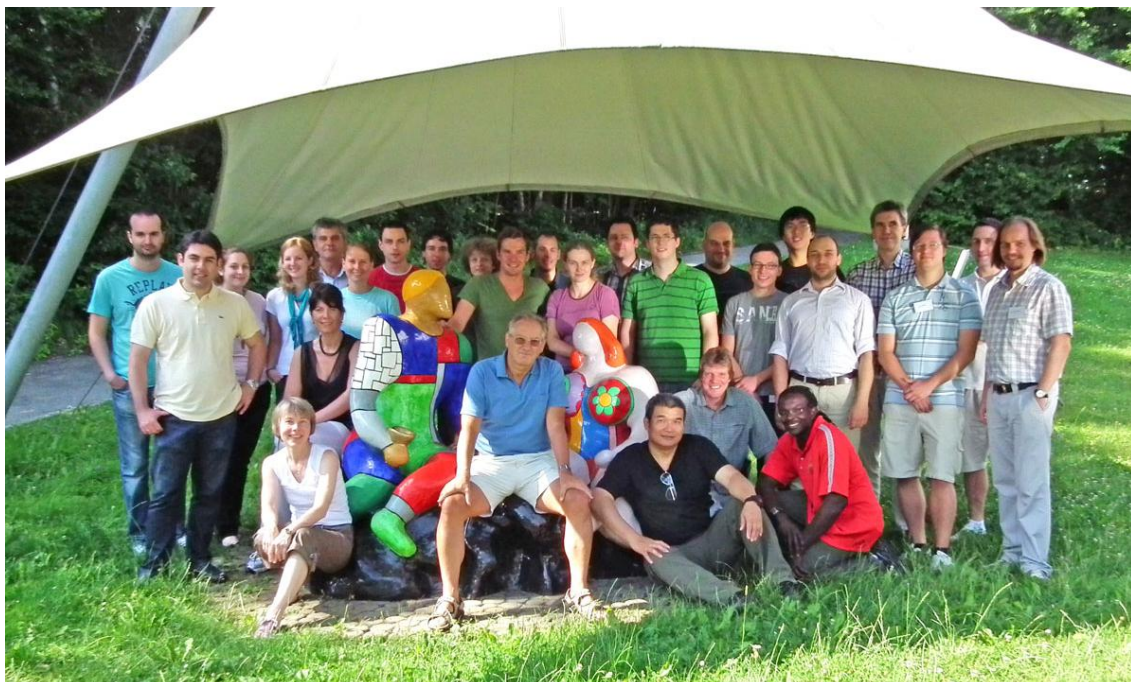
Teilnehmer und Dozenten des Kursprogrammes im Jahr 2010

Die Evaluation am Ende des Kurses 2010 ergab eine hohe Zufriedenheit der Kursteilnehmer.