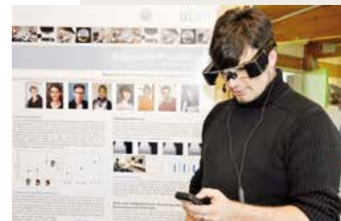
Kognitive Systeme helfen, technische Systeme anwenderfreundlicher zu machen. Der neue Ulmer Masterstudiengang »Cognitive Systems« verbindet Informatik und Psychologie.