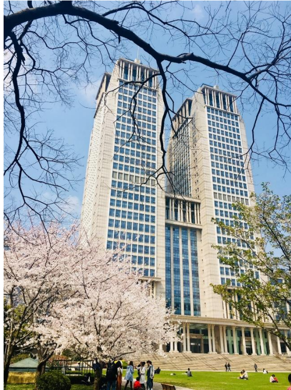
Die Guanghua Towers der Fudan University

Die Fudan University gehört zu den renommiertesten Universitäten in China, was man auch immer an den ehrfürchtigen Reaktionen der Chinesen gemerkt hat, wenn man erzählt hat, was man in China macht. Der Campus ist riesig und wunderschön.