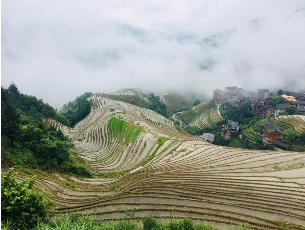
Blick auf die Reisterrassen von Longji

Was ich leider nicht geschafft, aber dennoch dank einiger Kommilitonen empfehlen kann, sind die „Avatar Mountains“ im Zhangjiajie National Park. Nahe Shanghai gibt es einige kleinere Städte, wie zum Beispiel Hangzhou und Suzhou, und etwas weiter weg (etwa drei Stunden mit dem Zug) liegt Nanjing, was historisch sehr viel bietet und daher echt zu empfehlen ist. Besonders gut hat mir die Stadt Xi'an gefallen, welche mit einer etwa siebenstündigen Zugfahrt zu erreichen ist und ein ganz anderes Flair als Shanghai innehat. Die Menschen sind freundlicher, die Stadt an sich ist grundsympathisch und es gibt ein tolles muslimisches Viertel mit unglaublich gutem Essen. Zudem kann man von dort aus die weltbekannte Terrakotta-Armee besuchen. Außerdem ist natürlich ein Aufenthalt in der Hauptstadt Peking mit einem Tagestrip zur Chinesischen Mauer ein Muss. Sollte mehr Zeit übrig sein, kann ich aus zweiter Hand noch Chengdu (Stichwort Pandabären) empfehlen.