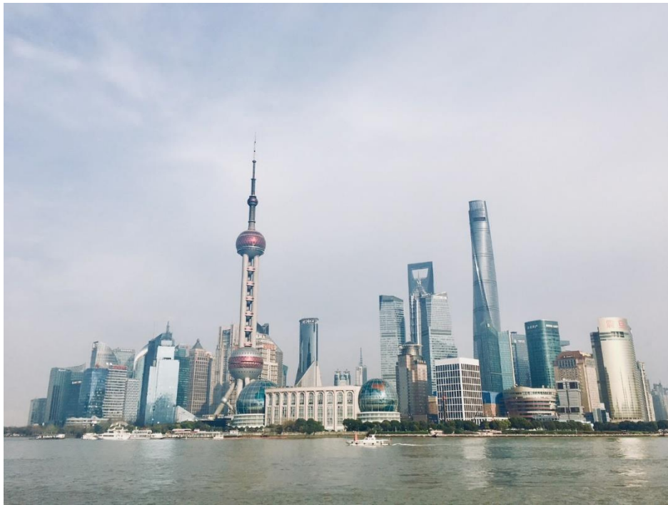
Die Skyline von Shanghai bei Tag ...

überhaupt nicht schwer. Das Metronetz ist super übersichtlich, alle Informationen sind auch in Englischer Sprache verfügbar und die Preise mit RMB 4 bzw. EUR 0,50 sind unschlagbar günstig. Die Universität und alles im Umkreis ist durch die Linien 3 und 10 angebunden, wobei man mit letzterer in etwa 30 Minuten Fahrt Downtown ist. Dort sollte man natürlich den Bund bei Tag und Nacht gesehen haben (kleiner Tipp: südlich vom eigentlichen Bund ist es deutlich schöner und ruhiger), eine Shoppingtour auf der East Nanjing Road machen, die kleinen, verwinkelten Gassen des verwunschenen Tianzifang erkunden und die wunderschönen, im Kolonialstil gehaltenen Häuser bei einem Spaziergang durch das French Concession bewundern.