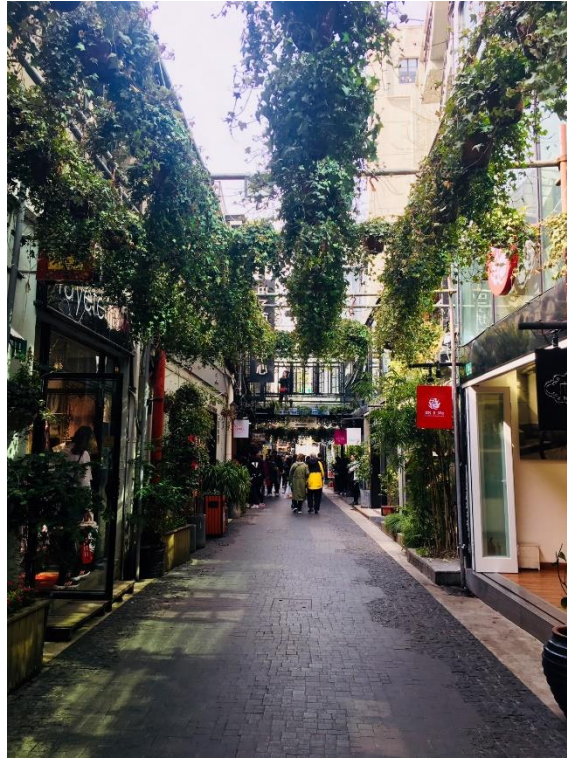
Die kleinen Gassen von Tianzifang

Abgesehen vom Metronetz ist leider nicht alles bilingual verfügbar und man muss sich kulturell an einiges gewöhnen. Chinesen sind oft nicht besonders hilfsbereit oder rücksichtsvoll, weshalb diverse Apps als Hilfe zur Überwindung der kulturellen Differenzen sehr zu empfehlen sind: