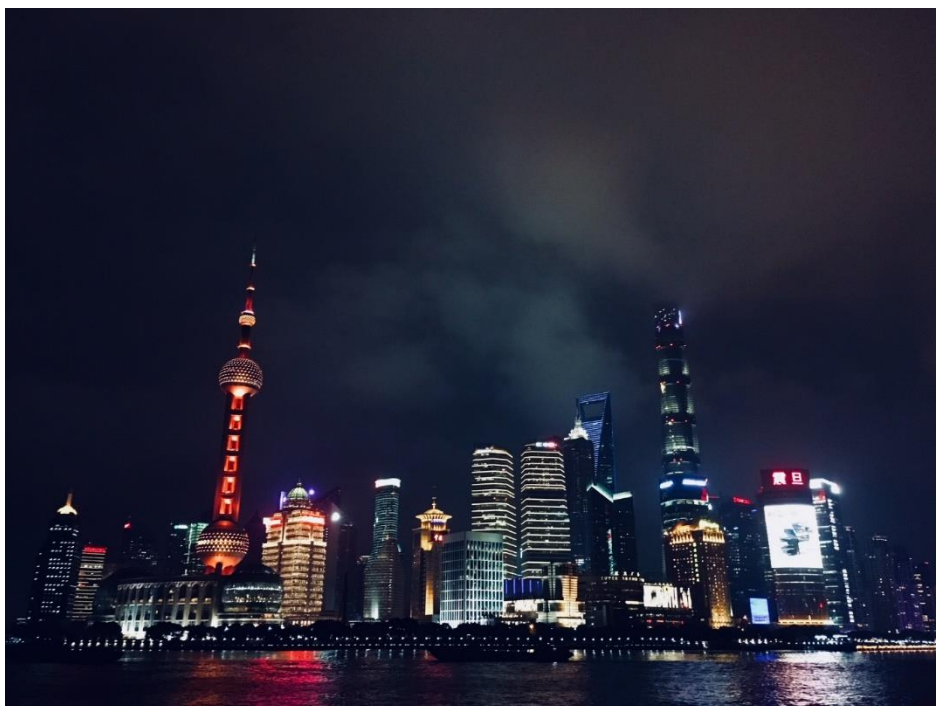
... und bei Nacht