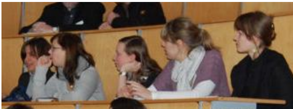
Studierende beim Lernstrategietraining

Hochschuldidaktische Weiterbildung u.a. zum Einsatz von Lernstrategien beim Lernen mit Medien an der Uni und ETH Zürich