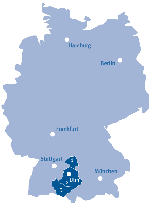
Universitätsklinikum Ulm, Krankenhaus für die Maximalversorgung der Regionen Ostwürttemberg (1), Donau/Iller (2) und Bodensee-Oberschwaben (3)