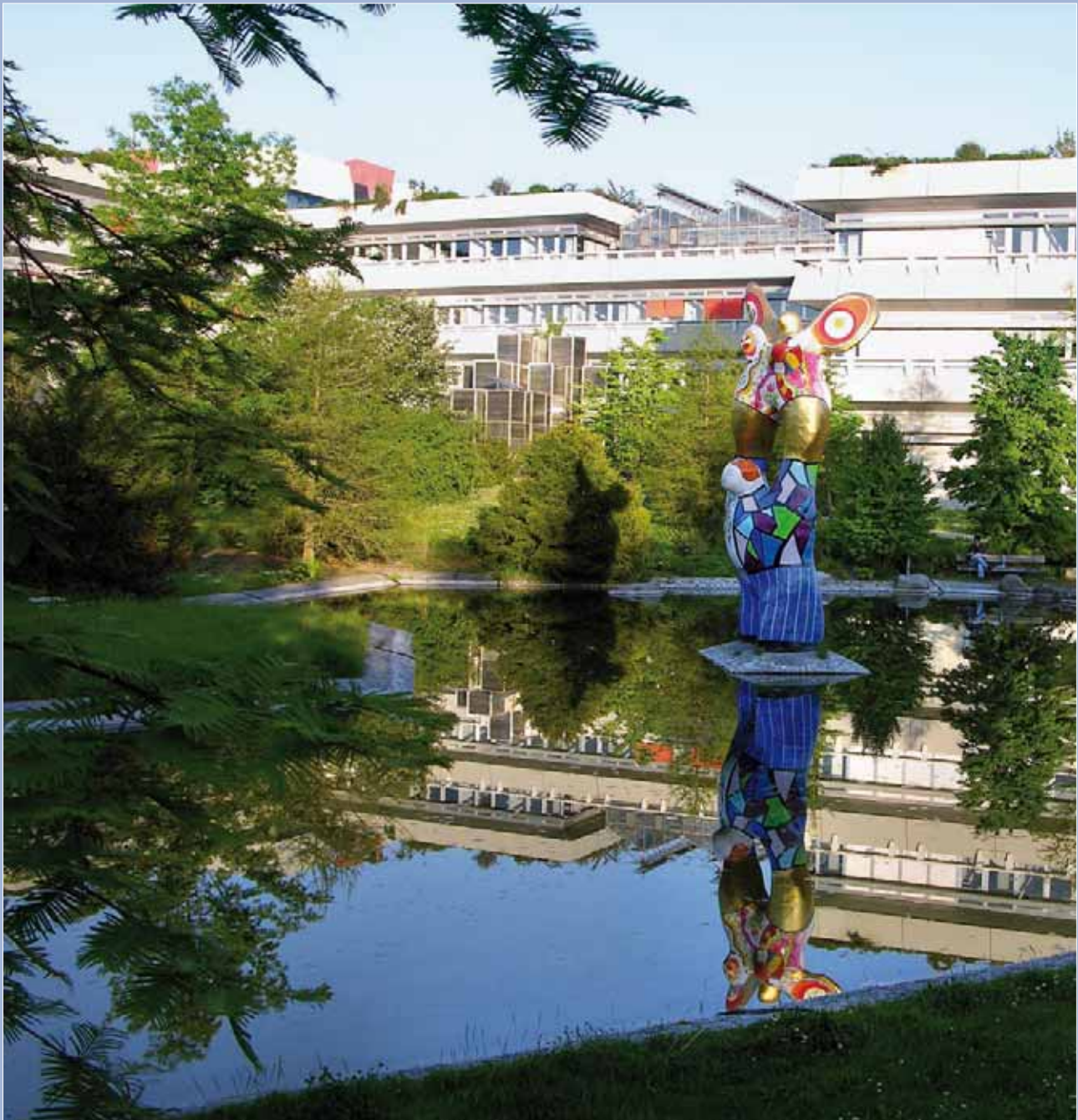
Ort der Entspannung und Ideen: die Statue der Künstlerin Niki de Saint Phalle „Le poète et sa muse“ auf dem Kunstpfad der Universität, Oberer Eselsberg