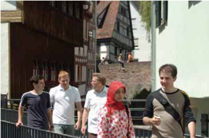
Die Ulmer Altstadt lässt sich am besten zu Fuß entdecken.

In der ehemaligen Pionierkaserne befindet sich das HfG-Archiv. Es wurde 1987 von der Stadt Ulm auf Initiative ehemaliger Angehöriger der Hochschule für Gestaltung eingerichtet und vermittelt Aufgaben, Inhalte und Bedeutung dieser epochemachenden Institution.