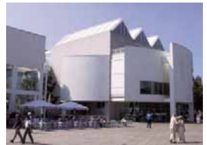
Das Stadthaus auf dem Münsterplatz

Ulm weist zahlreiche interessante Museen auf. Zu nennen ist insbesondere das Ulmer Museum mit festen und wechselnden Kunstaussstellungen, einem großen Bereich „Stadtgeschichte“ und bedeutenden archäologischen Fundstücken. Hier steht u.a. der Löwenmensch, die älteste Mensch-Tier-Plastik der Welt (ca. 30.000 Jahre alt).