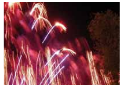
Abschlussfeuerwerk zum Internationalen Donaufest, das alle zwei Jahre im Verbund mit den Donau-Anrainerstaaten veranstaltet wird.