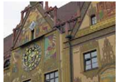
Das Ulmer Rathaus