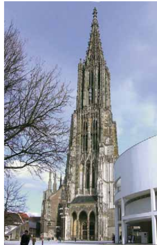
Das Ulmer Münster: Wer die 768 Stufen erklimmt, überwindet etwa 161 Höhenmeter und hat beste Aussichten.

Ulm und Neu-Ulm sind wirtschaftlicher Mittelpunkt der großen Region zwischen Alb und Bodensee. Schon ein Blick auf die Landkarte verdeutlicht, dass in Süddeutschland „kein Weg an Ulm vorbeiführt“. Vom Knotenpunkt der Autobahnen A7 und A8 ist es nicht weit in die Nachbarländer Österreich und Schweiz sowie nach Frankreich und Italien. Beide Städte, Ulm und Neu-Ulm, betreiben seit dem Jahr 2000 über den „Stadtentwicklungsverband Ulm/Neu-Ulm“ (SUN) eine gemeinsame Gewerbeansiedlungspolitik. Alleine im Ulmer Wirtschaftsraum sind über 8.500 Gewerbebetriebe aus den unterschiedlichsten Branchen vertreten, darunter auch viele Unternehmen mit weltweitem Renommee. In Ulm gibt es heute weit mehr als 100.000 Arbeitsplätze, wobei die Universität Ulm mit ca. 8.600 Arbeitsplätzen der größte Arbeitgeber ist.