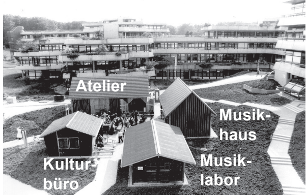
Das Musische Zentrum MUZ - mitten in der Universität Ulm

Musisches Zentrum Universität Ulm Oberer Eselsberg, 89069 Ulm, Telefon Kulturbüro: 0731 / 50 - 2 2420 Atelier: - 2 2421, Musiklabor: - 2 2422 Ton-Atelier Wiblingen: - 5916, Fax: - 2 2417, Windharfe: - 2 2419 und www.uni-ulm.de/einrichtungen/muz/windharfe.html