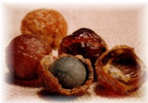
Abbildung 1: Indische Waschnüsse mit schwarzem Kern

Was genau ist denn diese kleine orange Nuss, die in ganz Europa gerade eine Waschmittelrevolution auslöst eigentlich? Und wie wirkt diese Waschnuss?