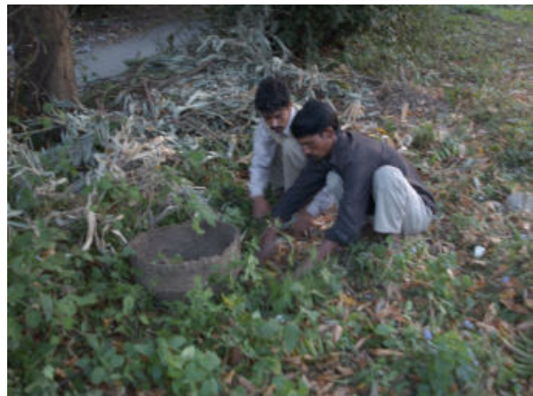
Abbildung 4: Inder beim Sammeln der abgeschüttelten Waschnüsse

Betrachtet man den Anbau der Waschnüsse bzw. der Soapnutbäume, so ist dieser leicht und zudem ökologisch auch sinnvoll. Die Bäume können 10 Jahre nach dem Pflanzen bereits das erste Mal abgeerntet werden. Danach kann ohne Pflege der Bäume einmal jährlich geerntet werden. Nach 100 Jahren sind die Bäume meistens nicht mehr ertragreich und sterben ab.