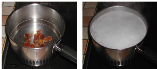
Abbildung 3: Kochen eines Waschnussuds

Um selber einen Sud aus den Nüssen zu brauen, kocht man einige Nüsse 10 Minuten mit Wasser auf und erhält einen individuell konzentrierten Waschnussud. Dieser kann dann einige Wochen als Shampoo, Geschirrspülmittel etc. genutzt werden.