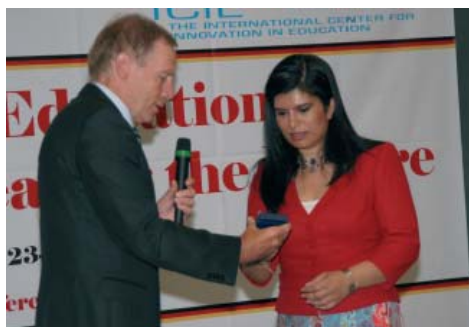
Prinzessin Sumaya und unser Präsident

Eine waschechte Prinzessin besuchte im August auf Einladung des „Center for Innovation in Education (ICIE)“ die Uni Ulm. Zur Eröffnung einer internationalen Bildungskonferenz, zu der Wissenschaftlerinnen und Wissenschaftler sowie Bildungspolitiker aus aller Welt eingeladen waren, gab sich die jordanische Prinzessin Sumaya bint El Hassan die Ehre. Ihr Heimatland hat der Prinzessin zufolge die Bedeutung von Bildung und dem Erwerb von Schlüsselkompetenzen wie internationale Erfahrungen und Toleranz bereits erkannt. „Bildung bietet Chancen und kann Freiheit und Frieden stärken. Sie müsse deshalb ganz besonders in den Entwicklungsländern gefördert werden“, betonte die im Bildungs- und Erziehungswesen Jordaniens engagierte Wissenschaftlerin. Träumen wir das Sommermärchen noch ein bisschen weiter und hoffen, dass die Wünsche der Prinzessin erhört werden.