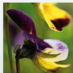
Viola tricolor Wildes Stiefmütterchen