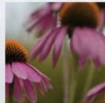
Echinacea purpurea Purpur-Sonnenhut