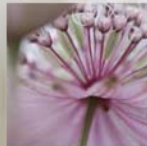
Atractia major Große Sternschale