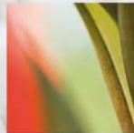
Gladiolus hybridus Gladiole