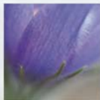
Pulsatilla vulgaris Gewöhnliche Kutschenschelle