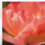
Rosa 'Cantille Provins'