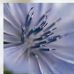
Cichorium intybus Gewöhnliche Wegwarte