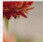
Xerochrysum bracteatum Gartenstrobilmaie