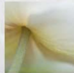
Anemone japonica 'Honoria Jøbert' Herbstanemone