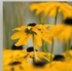
Rudbeckia fulgida var. millamii 'Goldsturm' Gelber Sonnenhut