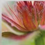
Monarda 'Gardenview Red' Indianerweidel