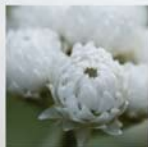
Anaphalis margaritacea Perlkräutchen