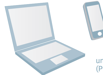
unterschiedliche Endgeräte (PC, Smartphones, usw.)