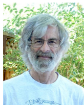
Abbildung: Leslie Lamport