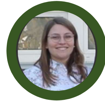
Felicitas Events, Mentoring

Spielt gerne Pokémon und liebt vietnamesisches Essen.