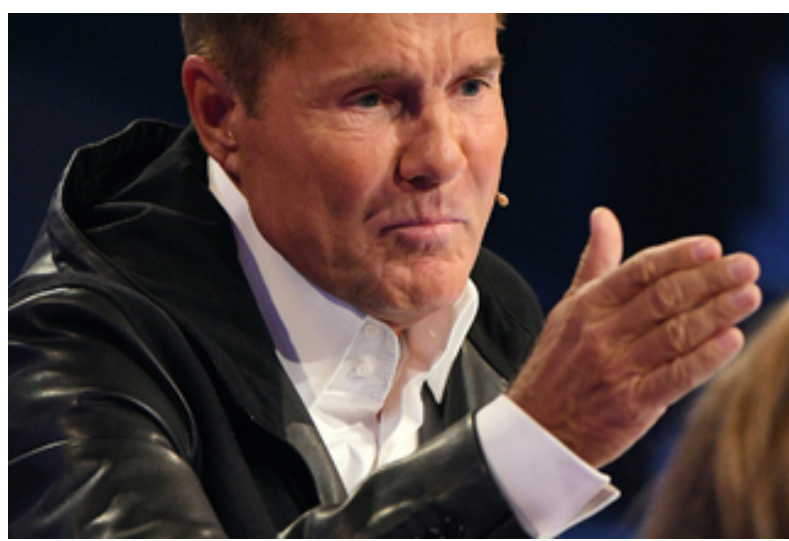
Ulm Alles Top Secret beim Supertalent-Casting in Ulm