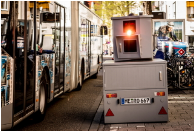
Ulm Stadt: Mobiler Blitzer in der Frauenstraße ist...