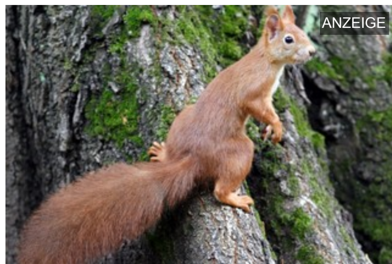
Letzte Ruhe an den Wurzeln eines Baumes