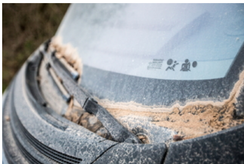
Ulm Verursacher der Sandplage steht fest