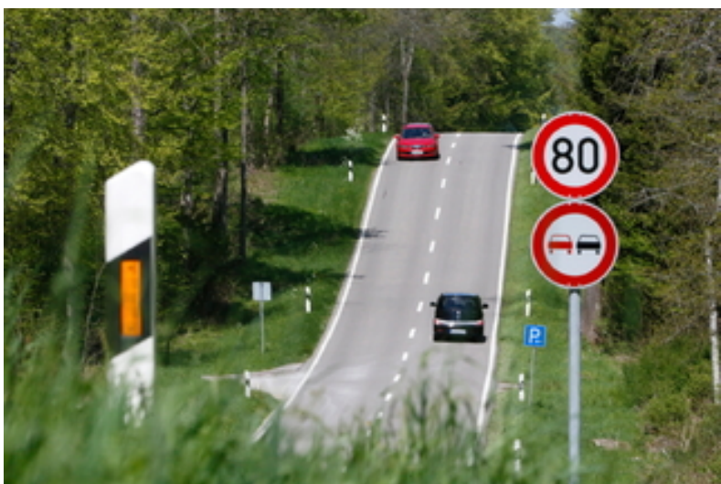
Amstetten Tempolimit im Ziegelwald: Autofahrer werfen...