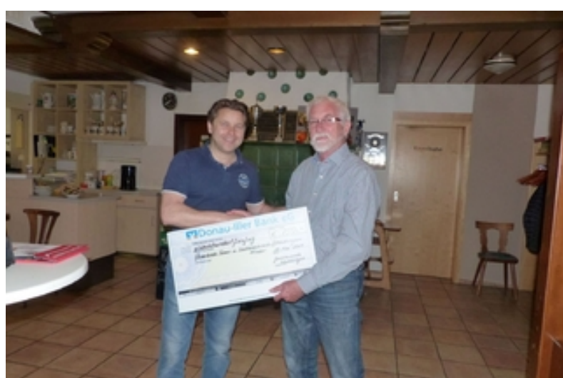
Schelklingen Gewerbeverein Schelklingen: Vorstand unvollständig