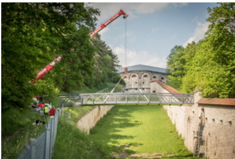
Ulm Über den Wallgraben führt wieder eine Brücke