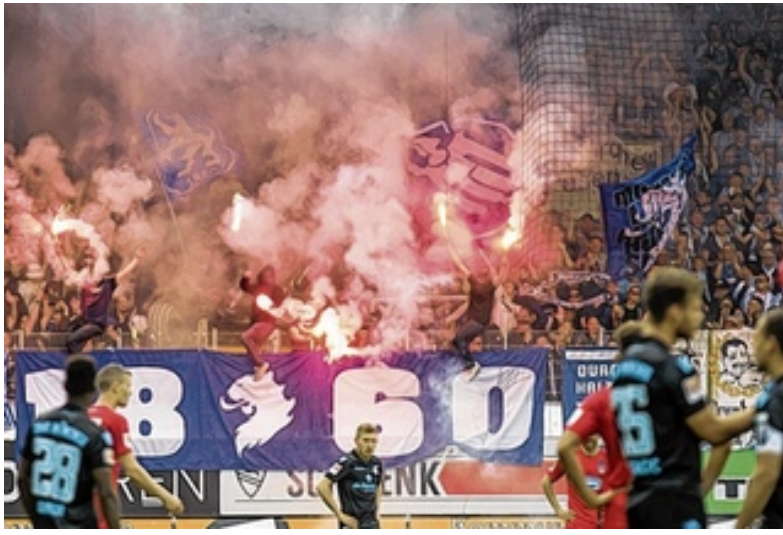
Heidenheim Fußballmarsch, Aufruhr und Pyrotechnik beim Spiel