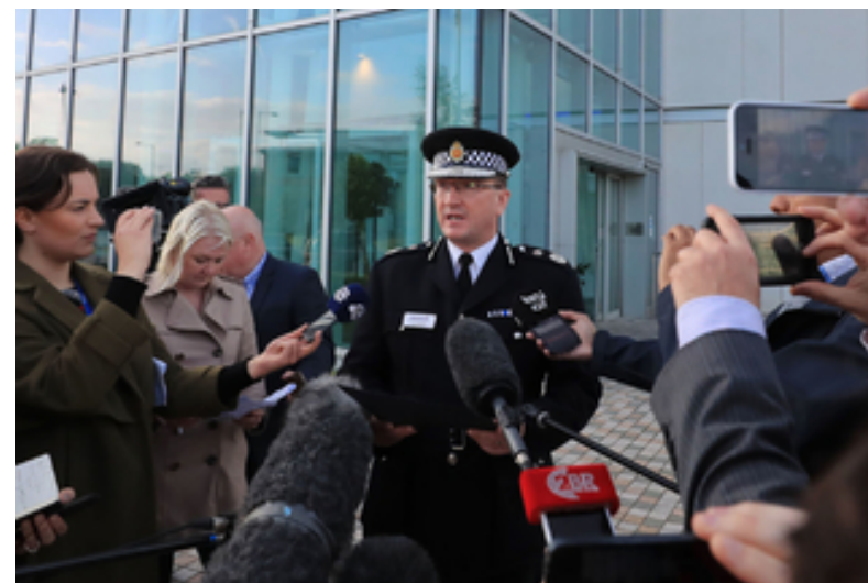
Manchester Bombenanschlag in Manchester: Polizei geht von...