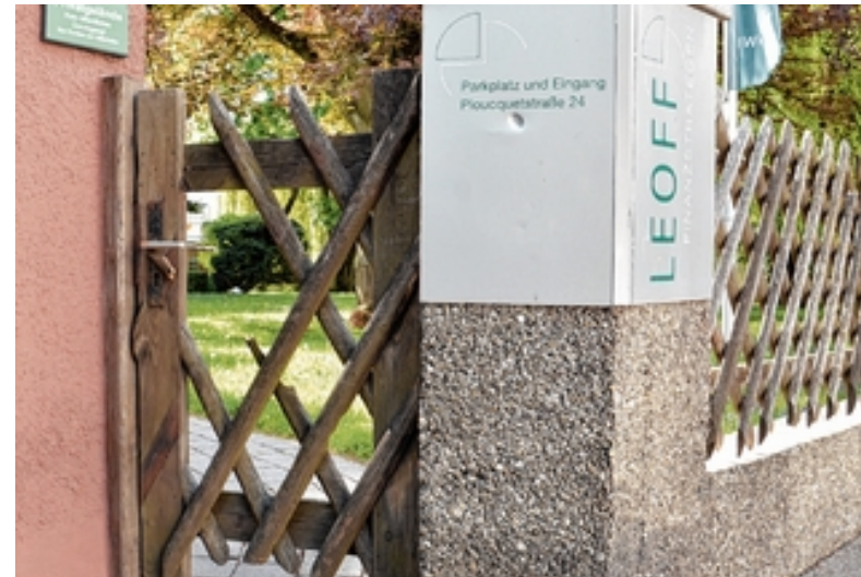
Heidenheim Problem-Viertel: Jetzt wird woanders randaliert