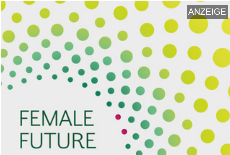
Das Praktikum mit Kick-off-Event.