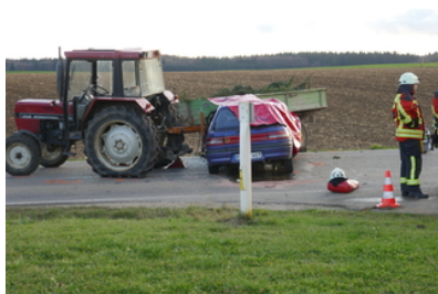
Laichingen Auto gegen Traktor - Junger Fahrer stirbt bei...