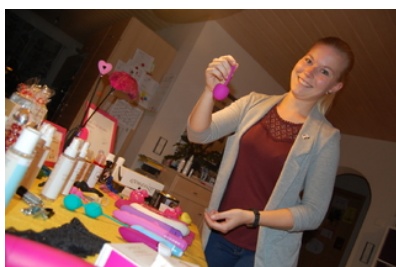
Göppingen Sexshop für Zuhause: Erotisches Spielzeug auf...