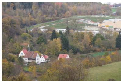
Ulm Tunnelbauarbeiten der Bahn nerven Anwohner im...