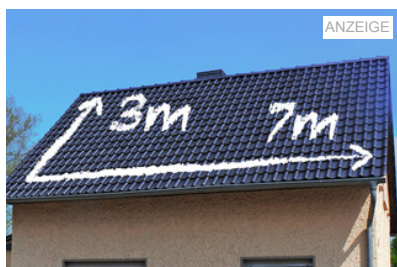
Was kostet eine Solaranlage?