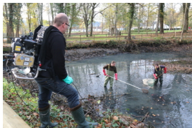
Gaildorf Der Fischereiverein birgt seine Überlebenden...