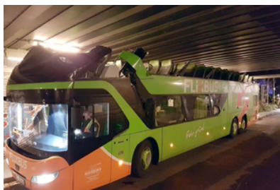
Berlin/Langenau Dach eines Flixbusses von Langenauer Firma an...