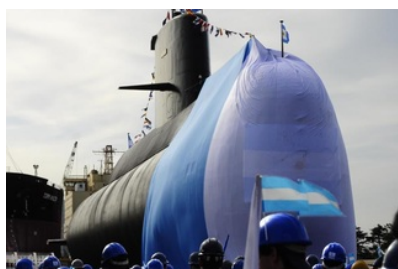
Buenos Aires Verschollenes U-Boot: Wasser im Schnorchel...