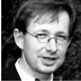
Dr. Wolfgang Fleck Grundzüge des Bürgerlichen Rechts (Teil I)