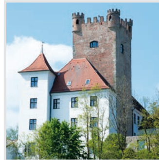
Wissenschaftszentrum | Schloss Reisenburg