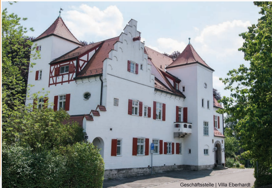
Geschäftsstelle | Villa Eberhardt