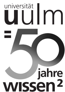
Vignette Graustufen (Eingeschränkte Kopierqualität)