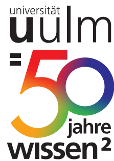
Vignette idealerweise auf weißem Hintergrund platzieren